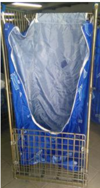
Vue de face, housse ouverte