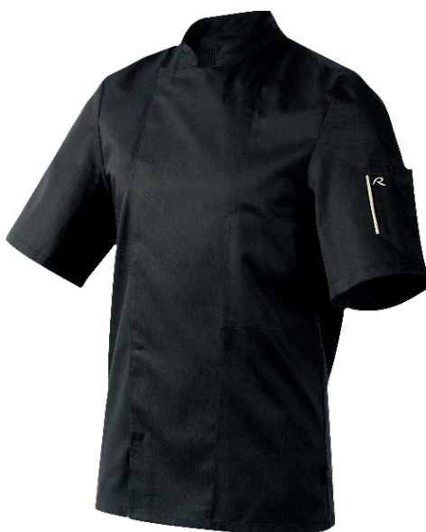
Veste Nero NOIR