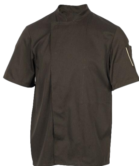
Veste Nero MOKA