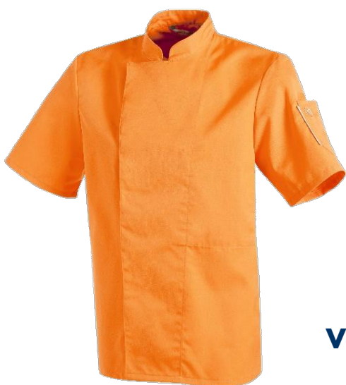
Veste Nero ORANGE

Col officier Fermeture devant par boutons pressions cachés Poche stylo manche